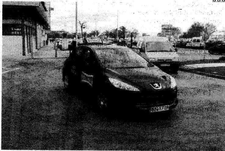
Los profesores de autoescuela demandan un convenio colectivo "digno".

Por tanto, con la concentración, los profesores de autoescuela "lo que queremos pedir a los empresarios es un horario y un sueldo digno, cumpliendo la legalidad, porque ellos quieren cobrar la intermediación entre profesores y alumnos y llevarse un porcentaje". Además, concluyó, "han entrado en una guerra de precios, que repercute en el sueldo del profesor y no dan opciones, o se acepta o te marchas".